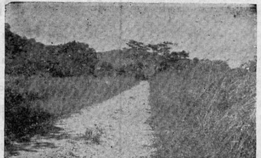
La construcción de Puentes y Carreteras de Penetración Agrícola, Salvarán a Turrialba y a las Regiones de la Zona Atlántica.